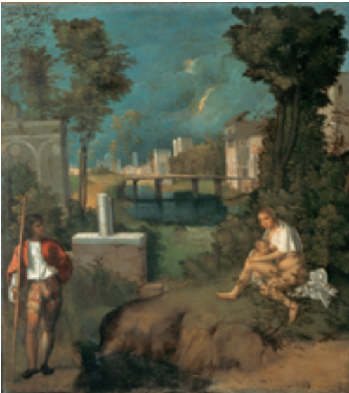
Η καταιγίδα , Τζορτζόνε, περ. 1508, 82×73 εκ., ελαιογραφία σε μουσαμά, Πινακοθήκες της Ακαδημίας, Βενετία

γράφους, όπως τον Τζορτζόνε (1477-1510), τον Τιτσιάνο (περ. 1488-1576) και τον Σεμπαστιάνο ντελ Πιόμπο (περ. 1485-1547). Ειδικότερα ο Τιτσιάνο, εξελίχθηκε σταδιακά στον κορυφαίο ζωγράφο της εποχής του, με τη φήμη του να εξαπλώνεται μάλιστα και εκτός Ιταλίας, στην Ισπανία και τη Γαλλία. Στον Τζορτζόνε και στον Τιτσιάνο οφείλονται επίσης σημαντικές καινοτομίες και σημαντικά επιτεύγματα στην απόδοση του τοπίου. Σε ό,τι αφορά τον εντυπωσιακό χειρισμό του χρώματος (εφάμιλλο με τον αντίστοιχο χειρισμό του σχεδίου από τον Μιχαήλ Άγγελο), επίγονοι του Τιτσιάνο υπήρξαν ο Τιντορέτο (1518-94) και ο Πάολο Βερονέζε (1528-88).