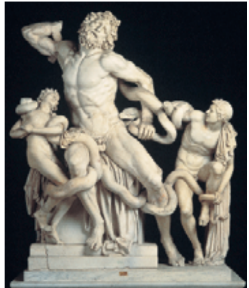
Ο Λαοκών και οι γιοι του, Γλύπτες: Αγήσανδρος, Αθηνόδωρος και Πολύδωρος, περ. 100 π.Χ., ύψος 2,10μ., μάρμαρο, Μουσεία Βατικανού, Ρώμη

Ακολούθησε περίοδος ακμής στις τέχνες και στα γράμματα, η οποία σηματοδεύτηκε όχι μόνο από την εμφάνιση σημαντικών έργων, αλλά και πολυ σημαντικών προσωποικότητων σε πεδία όπως η φιλοσοφία, η ρητορική, το θέατρο, η αρχιτεκτονική, η γλυπτική (Πολύκλειτος, Φειδίας, Μύρων, Πραξιτέλης κ.ά.).