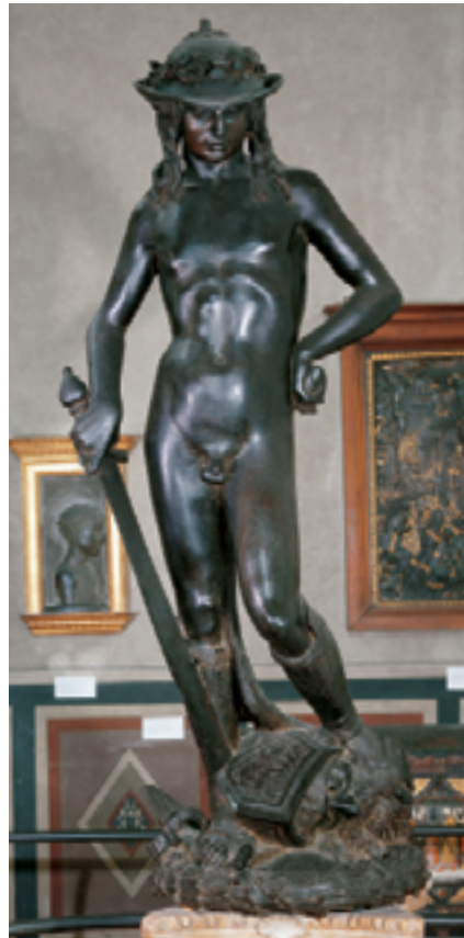
Δαβίδ, Ντονατέλο, περ. 1433, ύψος 158 εκ., μπρούντζος, Μουσείο Μπαρτζέλο, Φλωρεντία

ληνική και ρωμαϊκή γραμματεία ευνόησε μια νέα προσέγγιση στα καλλιτεχνικά ζητήματα, αλλά και στον τρόπο ζωής. Οι καινούργιες αυτές ιδέες θα καλλιεργούνταν από μια νέα γενιά λογίων και καλλιτεχνών οι οποίοι θα γίνονταν σύντομα γνωστοί με τη γενική ονομασία ουμανιστές.