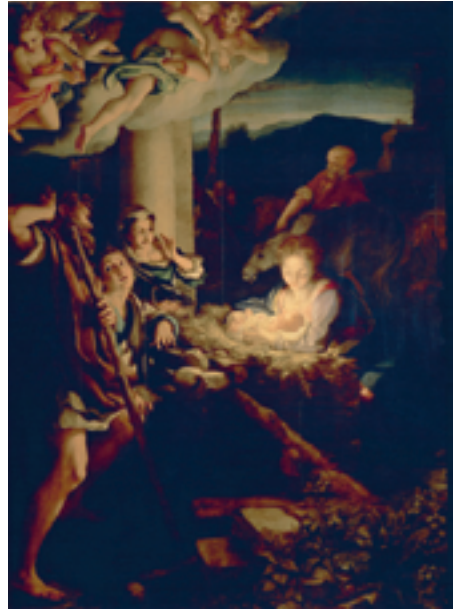
Η Γέννηση του Χριστού , Αντόνιο ντα Κορέτζο, περ. 1530, 256,5×188 εκ., ελαιογραφία σε μουσαμά, Πινακοθήκη Παλαιών Δασκάλων, Δρέσδη

Η πρώτη γενιά των μανιεριστών καλλιτεχνών, έχοντας αφομοιώσει τις κατακτήσεις της Ωριμης Αναγέννησης, υιοθέτησε ένα πιο «στιλιζαρισμένο» ύφος, σε έργα που διακρίνονταν για την έμφασή τους στο θεατρικό στοιχείο και στις πιο δυναμικές φόρμες. Ο Μανιερισμός άρχισε, ωστόσο, σχετικά σύντομα να αντιμετωπίζεται σαν συνώνυμο της επιτήδευσης, σαν ύφος που αποσκοπούσε στην επίδειξη των ικανοτήτων του καλλιτέχνη εις βάρος του περιεχομένου του έργου, με αποτέλεσμα να προκαλέσει την αντίδραση της Ρωμαιοκαθολικής Εκκλησίας κατά των υπερβολών του. Αν και ο όρος χρησιμοποιείται κυρίως για Ιταλούς καλλιτέχνες, υπήρξαν και βορειοευρωπαίοι μανιεριστές όπως Χέντρικ Χόλτσιους (1558-1617) και ο Μπαρτολομέους Σπράνγκερ (1546-1611), που διακρίθηκαν κυρίως ως ζωγράφοι μυθολογικών σκηνών και θεμάτων.