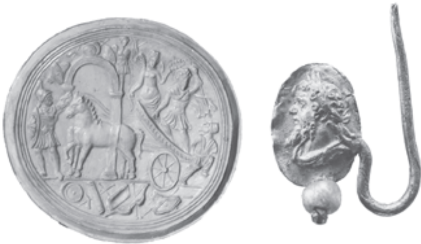
3, 4. Δύο ασυνήθιστα «αντικείμενα» με απεικονίσεις αυτοκρατόρων. Αριστερά: σύγχρονο αντίγραφο αρχαίου καλουπιού για κάτι σαν μπισκοτάκια (προοριζόνταν πιθανόν για θρησκευτικές γιορτές), με παράσταση θριάμβου αυτοκράτορα, τον οποίο στεφανώνει η θεά Νίκη. Δεξιά: σκουλαρίκια με τη μορφή του αυτοκράτορα Σεπτίμιου Σεβήρου.

Φυσικά, υπάρχουν πτυχές και εκφάνσεις της ζωής στη Ρωμαϊκή Αυτοκρατορία για τις οποίες πολύ λίγα πράγματα γνωρίζουμε. Τέτοιες είναι, ενδεικτικά, το πώς έβλεπε τον κόσμο μια γυναίκα της εποχής ή πώς ακριβώς διαχειριζόταν τα οικονομικά του ένας Ρωμαίος πολίτης. Θέλω να πιστεύω, πάντως, ότι ο αναγνώστης, κλείνοντας τα ανά χείρας βιβλίο, δε θα νιώθει απογοητευμένος για το πόσο λίγα γνωρίζουμε για τους Ρωμαίους αυτοκράτορες, αλλά ενθουσιασμένος για το πόσο πολλά έμαθε για αυτούς.